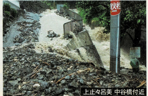
上止々呂美 中谷橋付近

今後また、このような台風や豪雨が、いつ襲来するか分かりません。その危険から身を守るためには、いつかではなく、今すぐの備えが必要です。