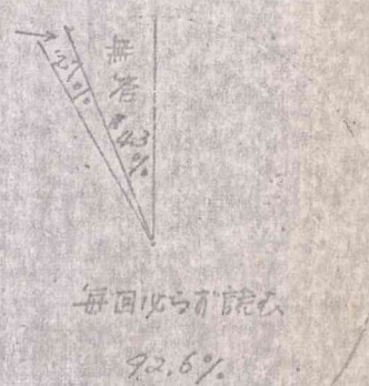
表III (自治会ニュースを読んだ人は)

十分満足は、新年度の自治会にまつて、定評されることを期待したいと思います。 良く読まれている自治会ニュースは、90%以上が毎回読む。 表IIでわかるように自治会ニュースは、多くの人がよく読まれているという結果が出ています。