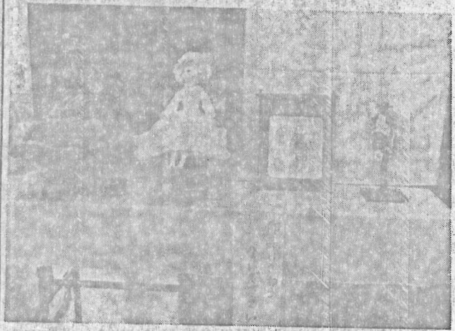
(目を楽しませてくれた「力作」の一つから……)

いずれも素人の水準を越えたりつばな作品で、「奥さま新聞」など、外部報道機関からも高い評価を受けたことはよろこばしい限りです。団