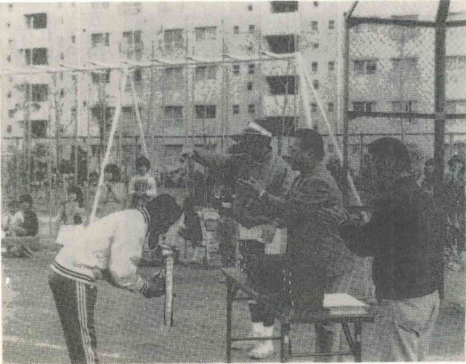
優勝チーム「16棟」表彰式

本大会に際しましては、一部雨にふられ、グラウンドの整備その他大会の運営につきまして、粟生第二住宅自治会、豊川北PTAソフトボールチーム、自治会ソフトボールチームエコーズの方々、その他関係の方々には、色々御苦労をいただき誠にありがとうございました。本紙面を借りましてお礼申し上げます。又、間谷区長、阪急間谷住宅自治会、東山住宅自治会、山ノ口自治会、