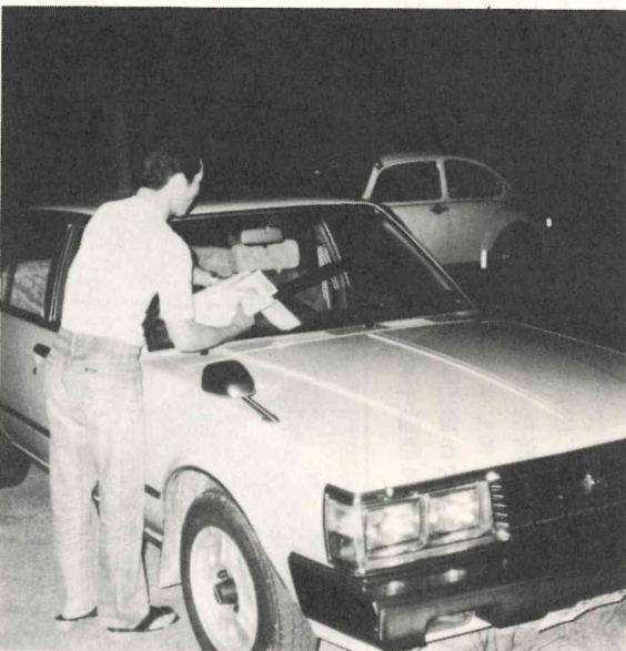
6月22日午後9時30分 団地内