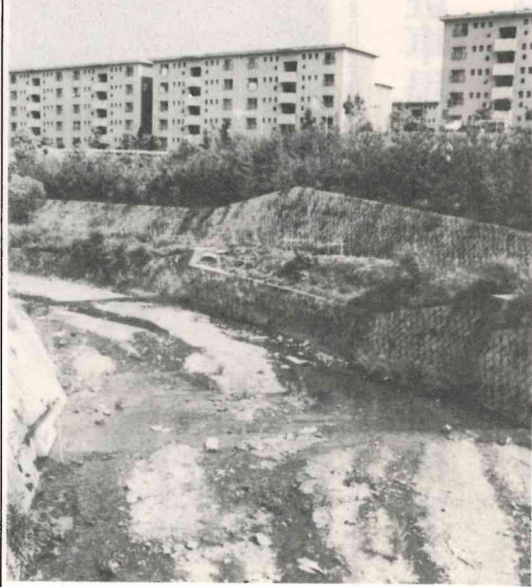
河川改修が行なわれた勝尾寺川

〔勝尾寺川発〕毎年六月になると夕暮から夜にかけ沢山のホタルが光を放ちながら飛び、時には団地の中までその可愛い姿をみせていました。都会の近くでこのような風景が見られなくなった昨今、広く新聞紙上で紹介され、全国的に有名な勝尾寺川のホタルが、いま全滅の危機に瀕しています。