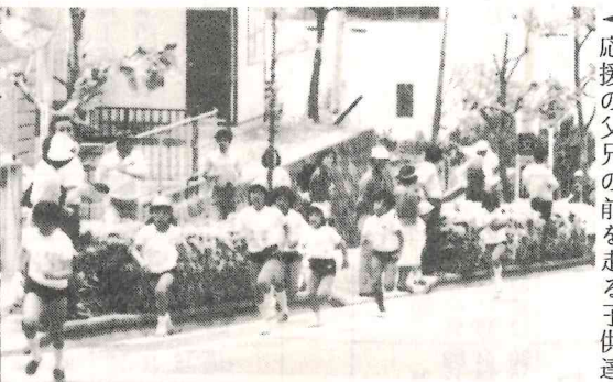
応援の父兄の前を走る子供達

一生懸命競技した子供達を讃え、共に応援をして下さった方々にもお礼を申し上げます。これからも地区子供会の活動に益々のご理解を頂き度う存じます。(子供会)