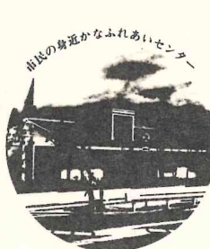
山の身元かなふれあいセンター

箕面市では各地域に小学校区単位でコミュニティセンターを建設する計画のもとで、粟生第二住宅には五十八年十一月に設立が決まりようやく六十年四月に市内で四番目のセンターとしてコミュニティセンター豊川北小会館「鐘の鳴る家」が開設されました。