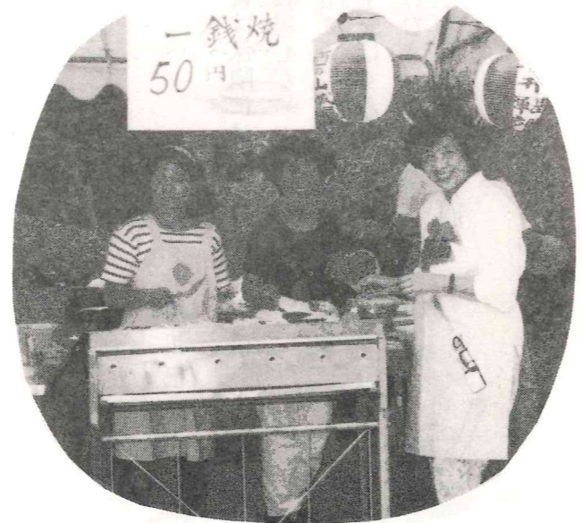
焼きに焼きました500食!! 一銭焼屋さんです。