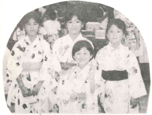
浴衣姿のかわいい子たちです。