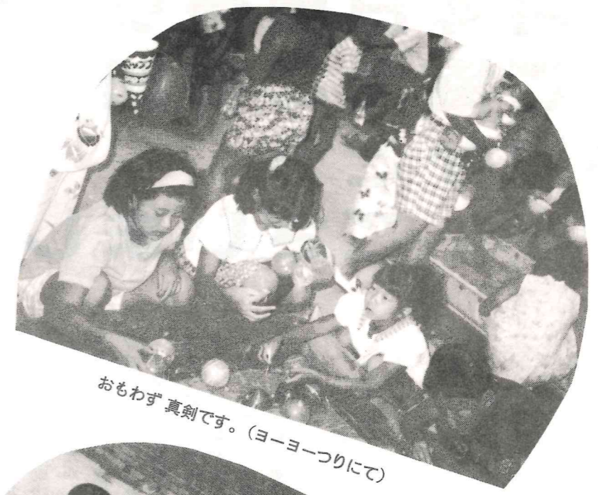
おもわず 真剣です。(ヨーヨーつりにて)