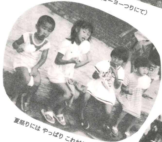
夏祭りには やっぱり これがなくっちゃ。