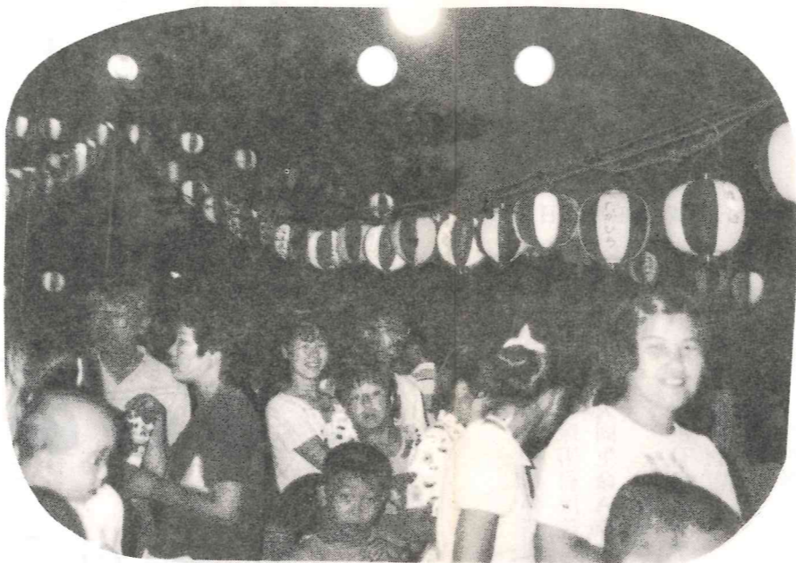
お祭り気分も最高潮です。