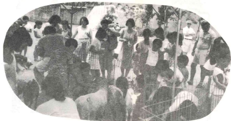
いっぱい動物さんと仲よくなりました。(移動動物園にて)