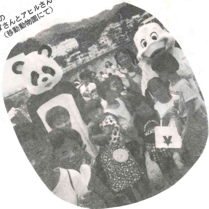
大人気の パンダさんとアヒルさんでした。 (移動動物園にて)