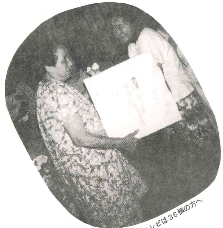
特等カラーテレビは36機の方へ いきました。