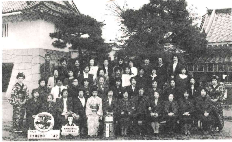
映画のメッカ 東映太秦映画村 京都観光記念

各棟のみなさんで、選出されました新役員の氏名を、現役員さんにより、一月に行なわれる集會に提出できるようになさって下さい。