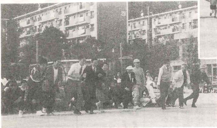
ご来賓の方々による防犯連想リレー