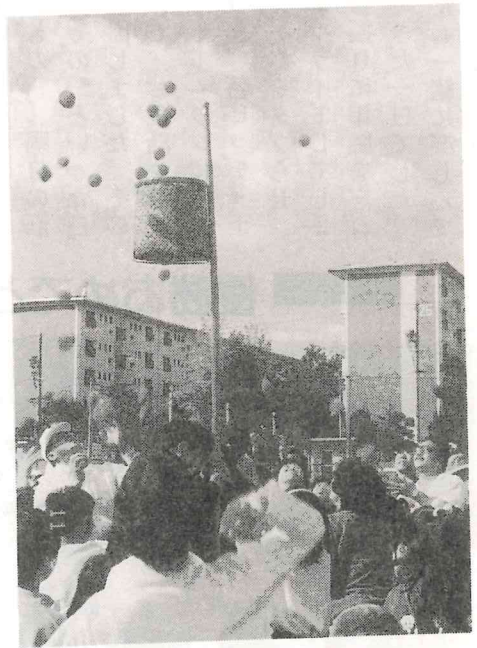
三世代交流による玉入れ

11月5日、豊川北小グラウンドにて、地域運動会が開催されました。参加人数は、二、六〇〇名余り。年々参加してくださる方が増えており、うれしいかぎりです。