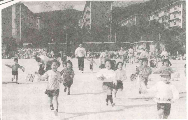
おみやげ競走を楽しむ子ども達