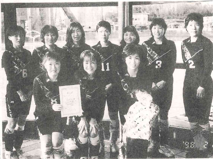
今年2月に優勝してBクラスへ上がりました