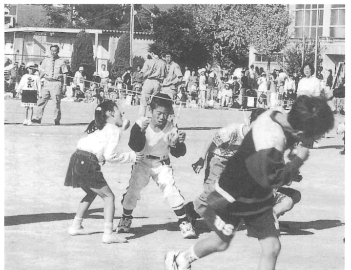
パン食い競争。手を使わずパンを取るのはムズカシイ。

開会式では箕面市青少年吹奏楽団、六中吹奏楽団による演奏の中、花の種をつけたたくさんの方船を、参加者の皆さんで、大空に舞い上げました。