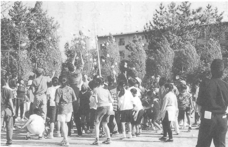
3世代参加の玉入れ。大勢の方に参加いただきました。

当自治会の役員は、実行委員、運営委員として参加。特に賞品担当は毎日6、7人が出かけ、参加賞などの賞品を約4000個、皆様のご協力も得て準備いたしました。