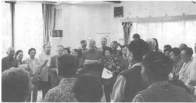
昼食懇談会で、皆で楽しく大合唱。

本年は役員会で、敬老の日の祝い品に対するアンケートや、昼食懇談会の実施について検討いたしました。