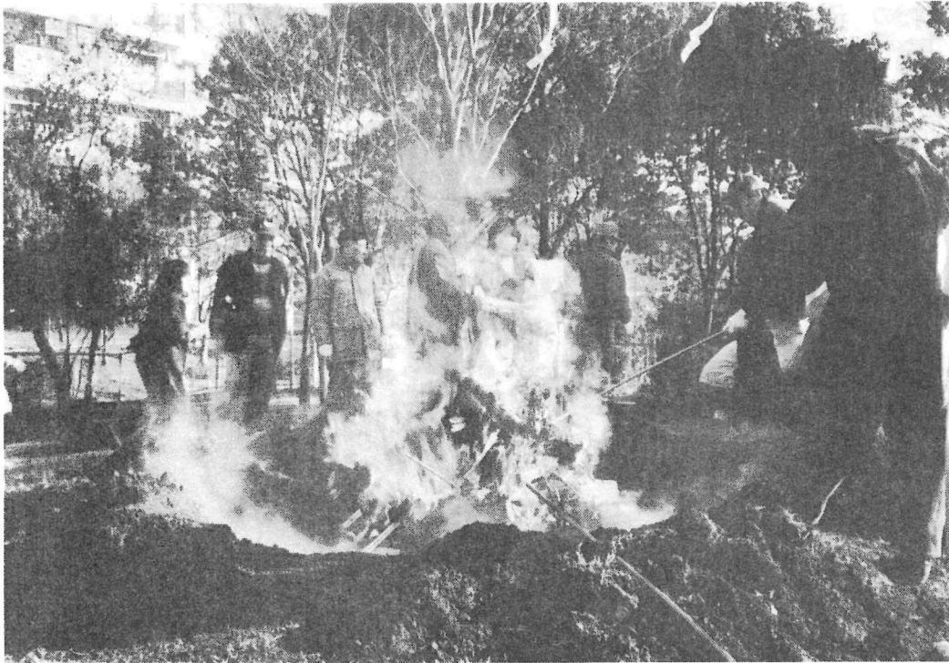
勢い良く燃え上がるどんどの火

粟生第二住宅 自治会ニュース 第206号 平成12年3月31日 発行 自治会 編集 広報部