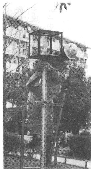
新しい外灯を取り付け中

昨年十一月から粗大ゴミの収集場所が変更になり不法投棄の減少など環境の改善が図られ、皆様方に、ゴミ問題に関して深い関心を持って頂き、役員一同ご協力に感謝しております。