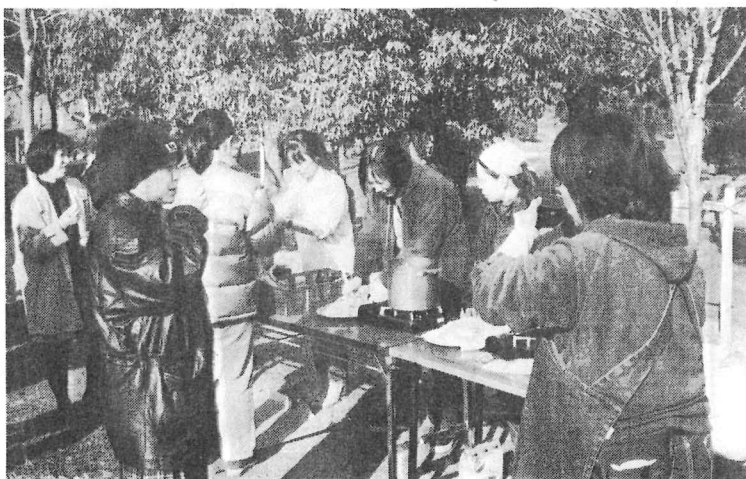
あつあつおぜんざいに