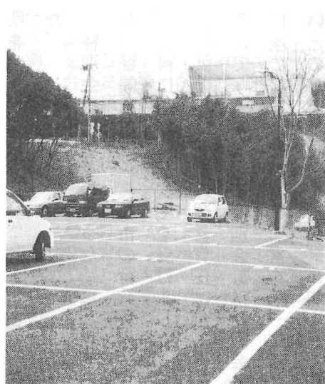
奥第1駐車場。奥の土手はきれいに、ラインも新しくなりました。