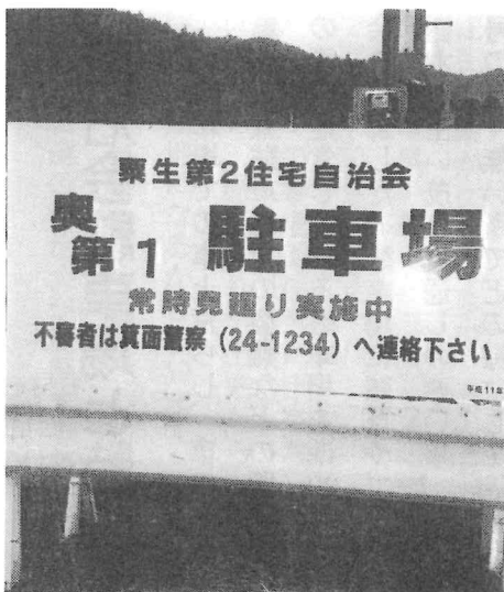
看板も新しく取り付けました

共有地上で生活している私達です。出来る事からこの環境の良い団地を皆様の参加で維持して行くにはありませんか。そして、この団地に居住して良かったと、人生の先輩から後輩へ継承する場を広げて行くにはありませんか。