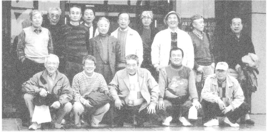
(メンバーの皆さんが揃ったお写真を掲載する事が出来ず、申し訳ありません。)