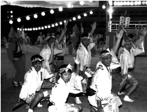
◀ なにわ連 ▶