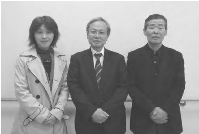
右から 岩崎副会長・会長・宇井副会長

われていることから、バランスの取れた持続可能な対応が必要となります。併せて、三・一一東日本大震災の教訓を活かすことも急務となっています。総会では、規約の改正により隣接した複数の棟から役員を選出することが可能となりました。第二住宅自主防災会の設立も報告をさせて頂きました。準備は整ってきています。