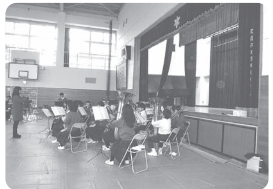
六中ブラスバンド部の名演奏