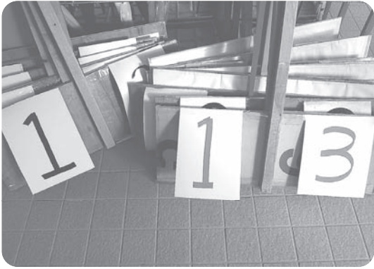
順位プラカードの出番なく

11月11日(日) 朝から あいにくの雨で 残念ながら運動会は 中止になりました