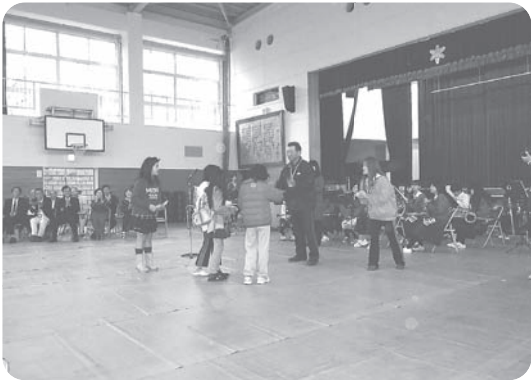
運動会ポスター 表彰式