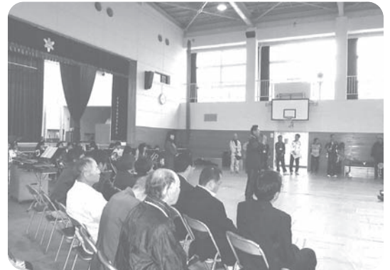
大会 会長 挨拶