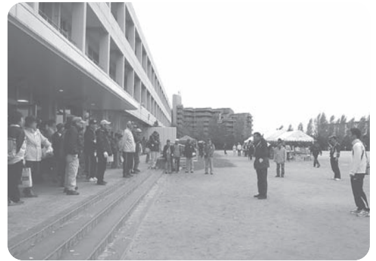
各役員への中止のアナウンス