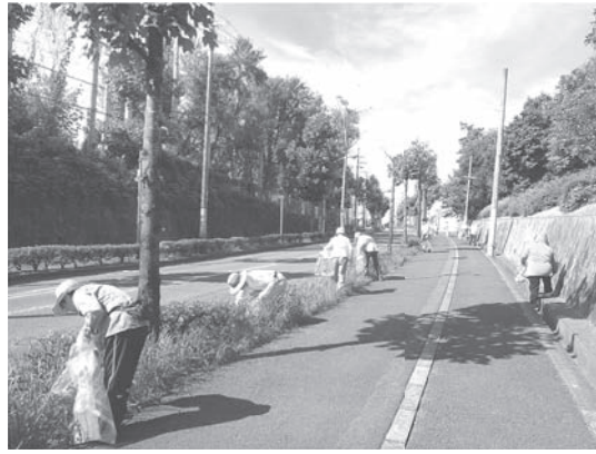
第二住宅周辺道路の清掃