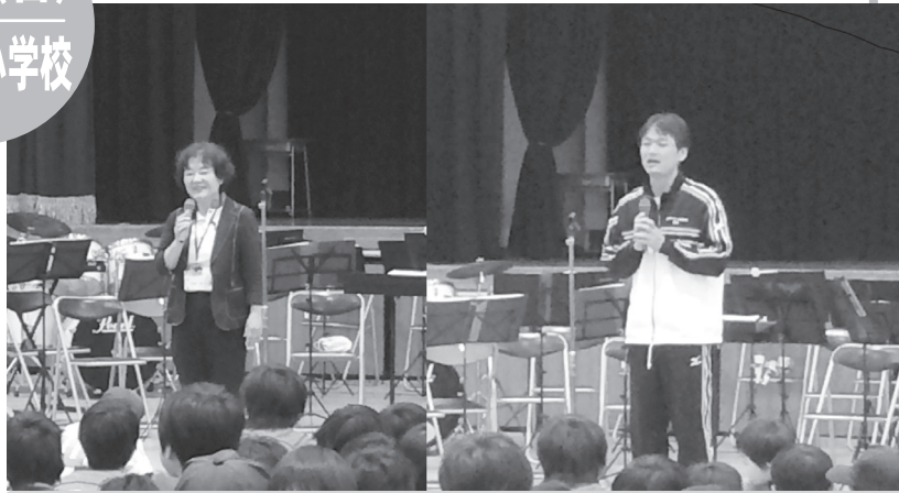
▲ 豊川北小学校校長先生