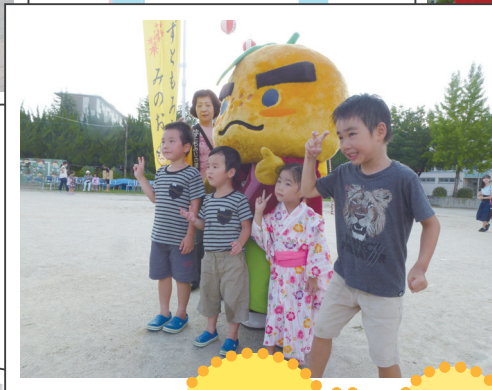
ゆずるくんと の撮影大会は ちびっこたちに大人気～♪