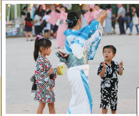
子どもたちも踊りのお師匠さん をまねて踊ります