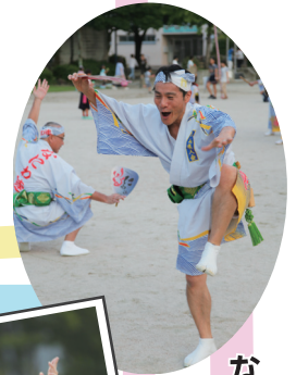
なにわ連の 鮮やかな踊り