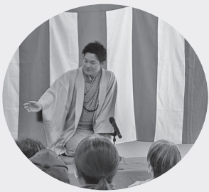
団地寄席が開催され、多くの方にご参加頂きました。