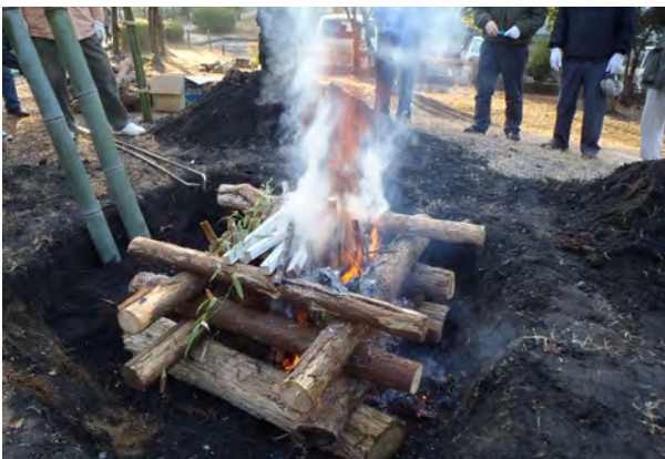
静かに煙が上がり始めました