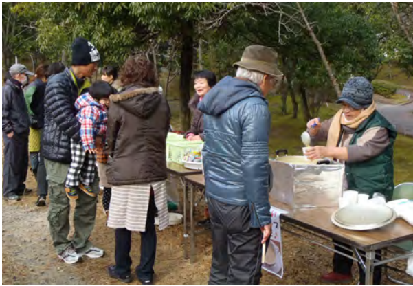
ぜんざい、コーンスープで暖をとりました