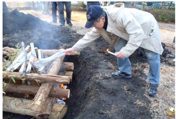
御神火を消さないように着火