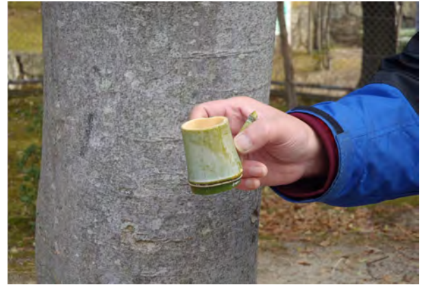
たんぼぼの会さん 手作りの竹おちょこです