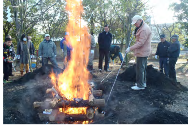
勢い良く炎が上がり年の始めが縁起良くスタート！