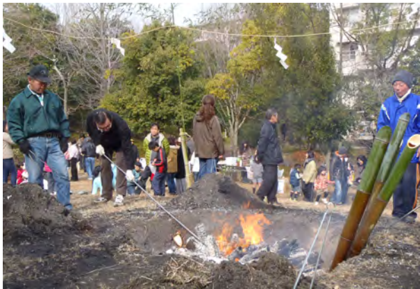
〜〜 たくさんの方に来場いただきました 〜