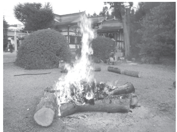
為那都比古神社の御神火