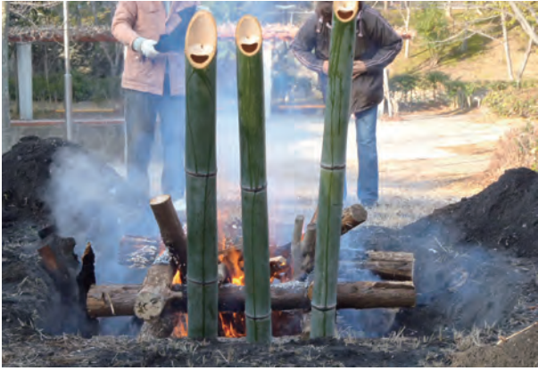
御神酒を竹筒に入れて温めると竹の香りがしてより一層おいしく