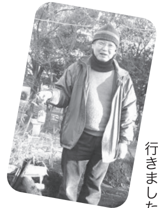
▲御神火を頂きに行きました