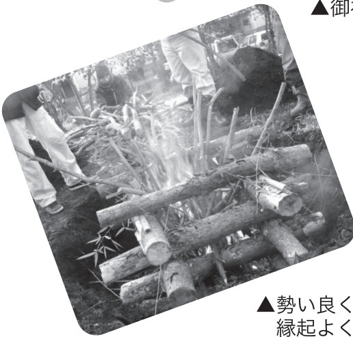
▲勢い良く炎が上がり縁起よく始まりました