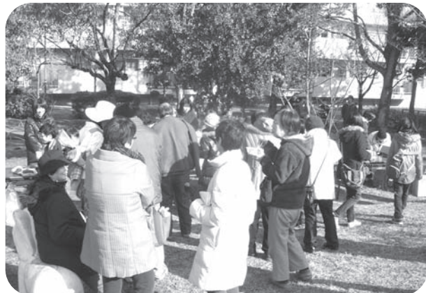
▲たくさんの方々にご来場頂きました。