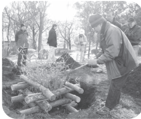
▲御神火を消さないように着火