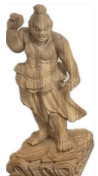
吽形 阿弥陀様 阿形

ひまわりで展示中です。穏やかな表情の阿弥陀様と対照的に険しい顔の金剛力士。鬼も慌てて逃げ出しそうです。