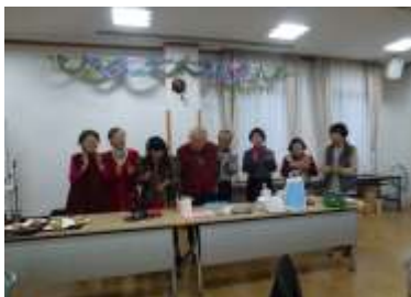
▲エンディングの大合唱をリードするメンバー

多くの方々に参加いただき、喜んでいただけたことが私たちにとっての最高の喜びです。